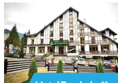
Hotel Escalade 4*