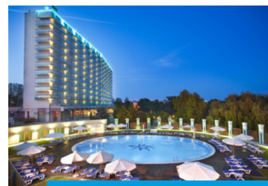
Hotel EUROPA 4*

Pentru detalierea serviciilor de cazare și pachetele family, solicitați consultantului dumneavoastră Ghidul Hotelier .