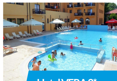
Hotel VERA 3*