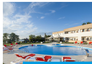
Hotel GG GOCIMAN 4*