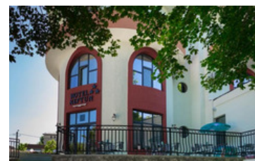
Hotel NEPTUN 3*