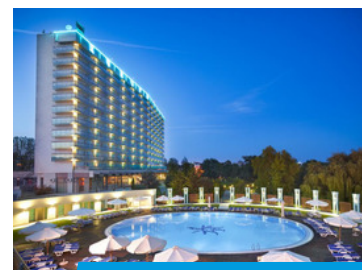
Hotel EUROPA 4*

Pentru participarea la curs trimiteți-ne formularul de înscriere completat și semnat.