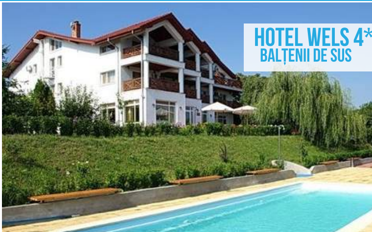
HOTEL WELS 4* BALȚENII DE SUS