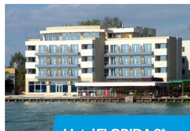
Hotel FLORIDA 3*