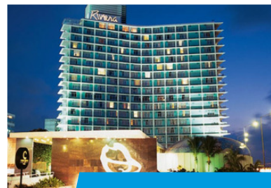
Hotel RIVIERA 3*