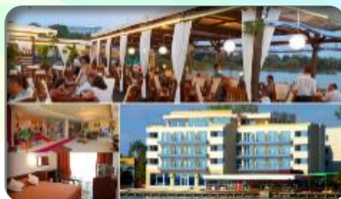
Hotel FLORIDA 3* - Mamaia 2511 RON redus la 2318 RON