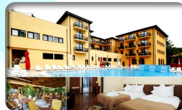
Hotel VERA 3* - Eforie Nord 2869 RON redus la 2648 RON