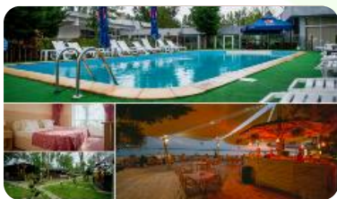
Hotel VOILA 3* - Mamaia 2343 RON redus la 2163 RON