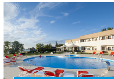
Hotel GG GOCIMAN 4*

Pentru detalierea serviciilor de cazare și pachetele family, solicitați consultantului dumneavoastră Ghidul Hotelier.