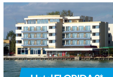
Hotel FLORIDA 3*